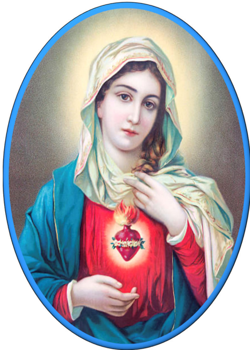
August Month of the Immaculate Heart of Mary